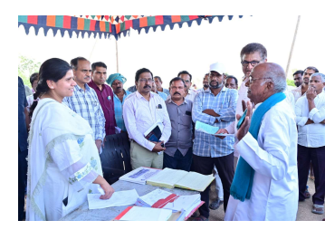
నాణ్యతా ప్రమాణాలను పరిశీలించి తూకం జరిపించాలని అధికారులను ఆదేశించారు. ప్రతి కేంద్రాన్ని సందర్శిస్తూ, ధాన్యం కొనుగోలు ప్రక్రియ సాగేలా జరిగేలా పక్కన్నంది పర్యవేక్షణ జరిపాలన్నారు. రైతులు నాణ్యతా ప్రమాణాలకు లోబడి, శుభ్రతరచి బాగా ఆరబెట్టిన ధాన్యం కొనుగోలు కేంద్రాలకు