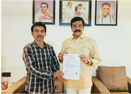
భీమ్గల్, బతుకమ్మ :అనారోగ్యంతో చికిత్స నిమిత్తం నిమ్స్ లో చేరిన భీమ్ గల్ మండల కేంద్రానికి చెందిన మధూర్ లావణ్య కుటుంబ సంభరాలు ఆదివారం ఎల్ ఓ సీని మాజీ మంత్రి, ఎమ్మెల్యే ఎల్ ఓ సీని అందజేశారు. భాగ్యశురారి చికిత్స కోసం అవసరమయ్యే రూ. లక్ష 50 వేల ఎల్ ఓ సీని ఎమ్మెల్యే మంజూరు చేయించి వారికి అందజేశారు. తమకు ఆపదలో సమయంలో ఆర్థికంగా ఆదుకొన్న ఎమ్మెల్యే కు వారి కుటుంబా సభ్యులు కృతజ్ఞతలు తెలియ జేశారు.