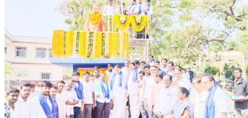
న్యాయం కోసం జీవితాంతం పోరాడిన మహానుభావుడు, భారతదేశానికి చికిత్స సేవలు అందించిన గవ్నూ నాయకుడు. వెనుకబడిన ప్రాంతాల నుంచి వచ్చి అనేక సవాళ్లను ఎదుర్కొని ఉన్నత సాహసాలకు ఎదిగిన మహాస్వతే పుక్తిగా ఆయనను